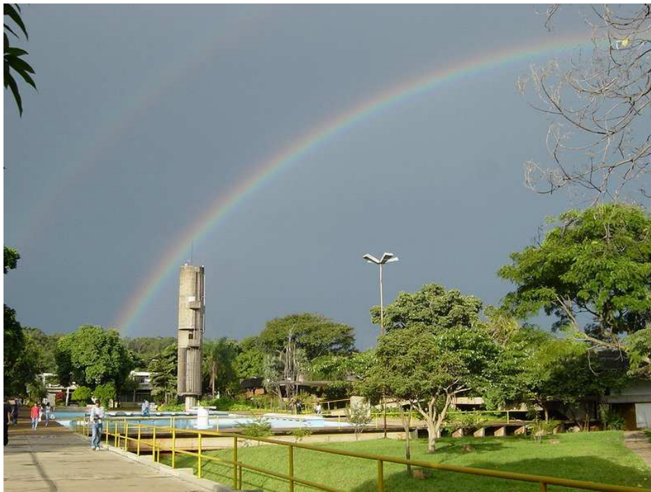
Faculdade de Ciências e Letras – UNESP, Campus de Araraquara - 2006.