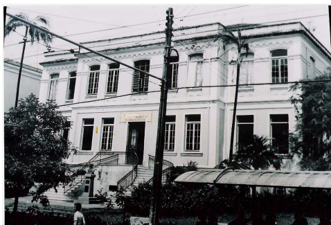
Faculdade de Filosofia Ciências e Letras, em 1961. Atualmente Casa da Cultura “Luis Antonio Martinez Correia”.

Em 1961, a Faculdade de Filosofia, Ciências e Letras foi transferida para o centro da cidade de Araraquara, ocupando, na Praça Santos Dumont, o prédio do Antigo Instituto de Educação Bento de Abreu (atual Casa da Cultura Luiz Antônio Martinez Correia). Ainda nesse ano, foi implantado o Curso de Química e em 1963, o curso de Ciências Sociais.